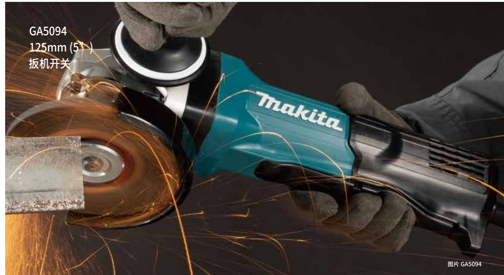
GA5094 125mm (5" ) 扳机开关