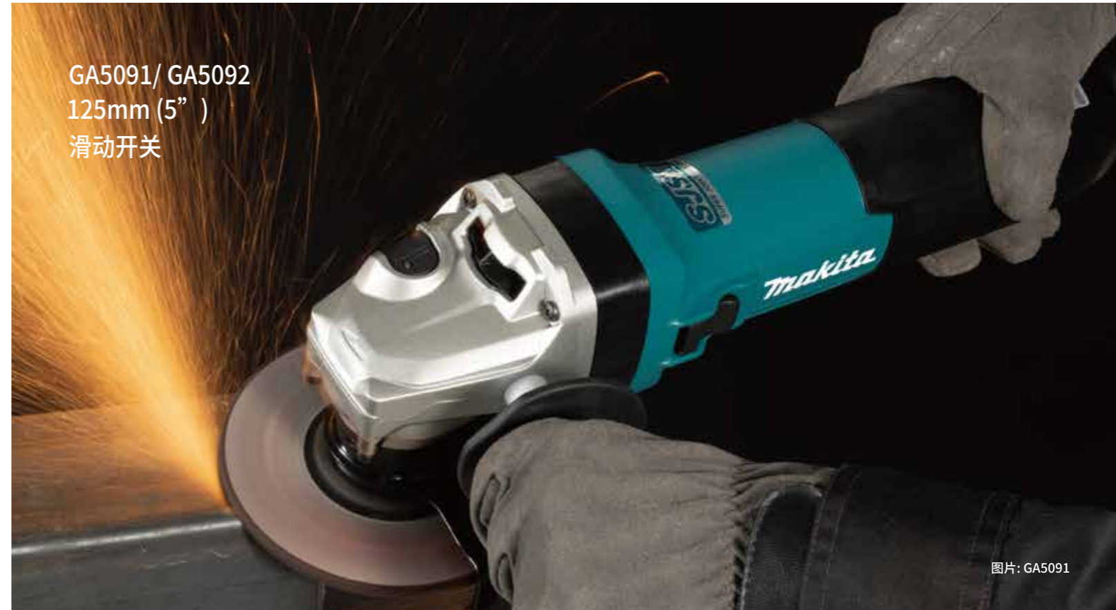
GA5091/ GA5092 125mm (5" ) 滑动开关